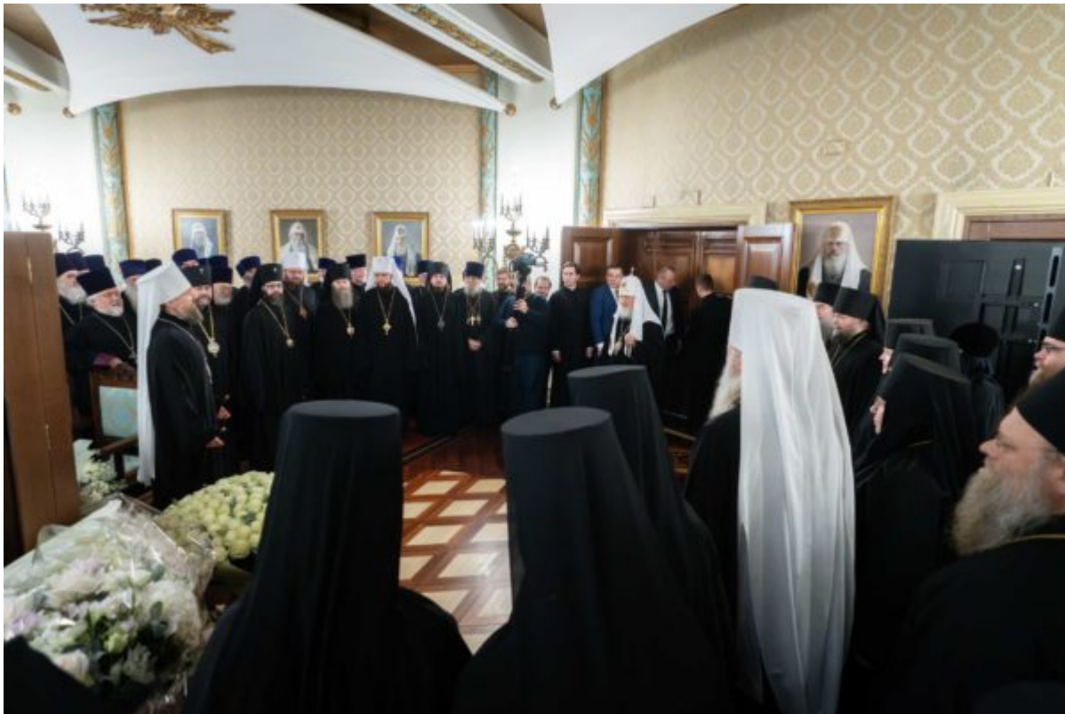
Τα μέλη της Ιεράς Συνόδου της Ρωσικής Ορθόδοξου Εκκλησίας”