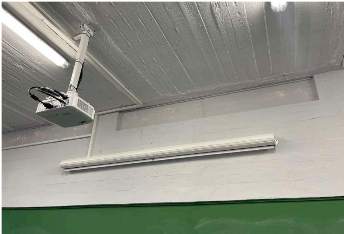
Τοποθέτηση νέου projector και ηλεκτρικής οθόνης προβολής.