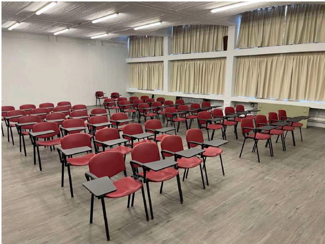
Οι δύο εκσυγχρονισμένες Αίθουσες Οπτικοακουστικής Διδασκαλίας της Θεολογικής Σχολής του ΕΚΠΑ.