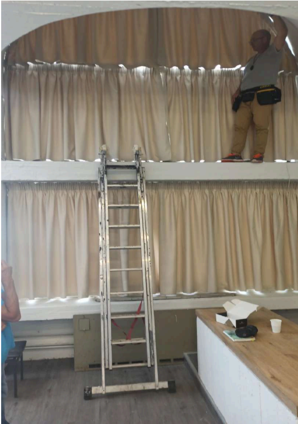
Τοποθέτηση νέων ηχομονωτικών κουρτινών.