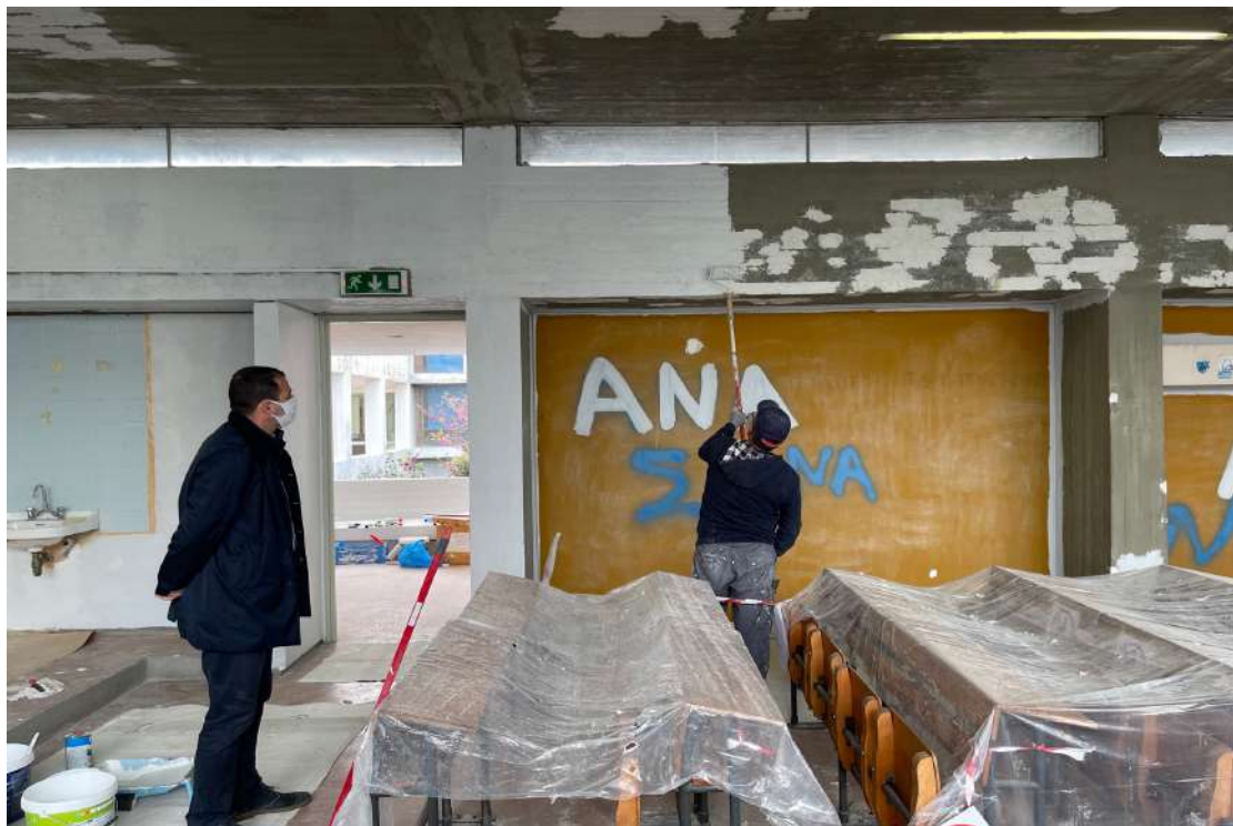
Αποκατάσταση του σκυροδέματος και του οπλισμού στην οροφή, στεγανοποίησή της και βάψιμο των επιφανειών της αίθουσας.