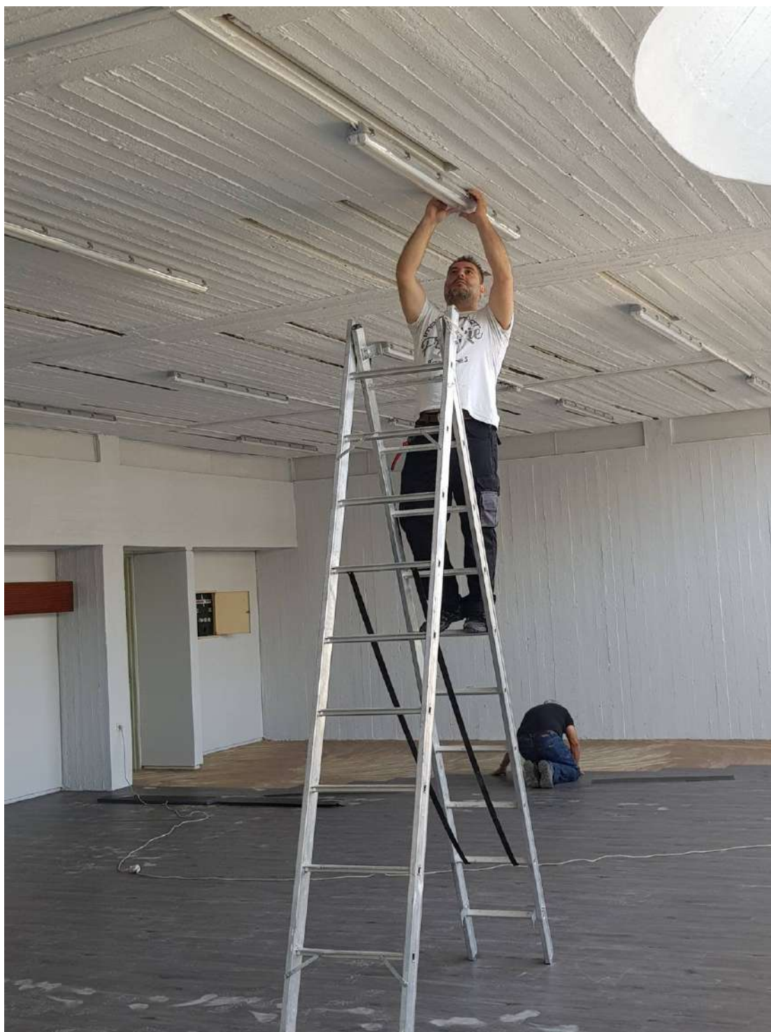
Τοποθέτηση νέου ηλεκτρολογικού υλικού και λαμπτήρων LED.