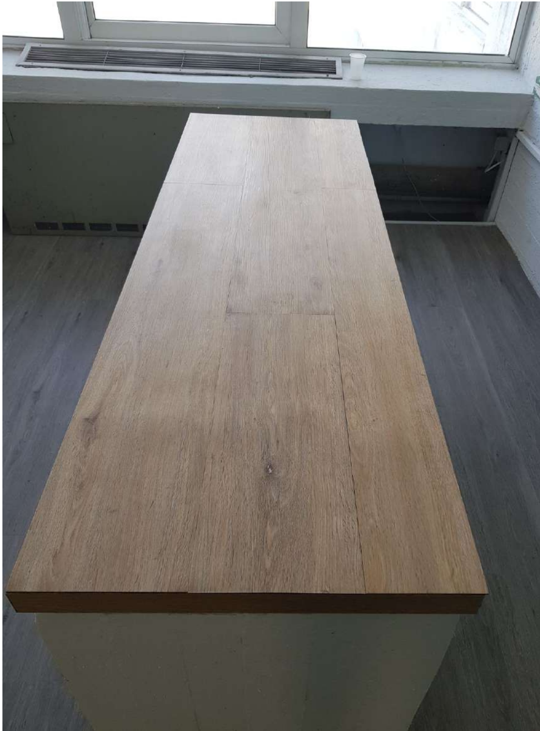
Η νέα έδρα του διδάσκοντος.