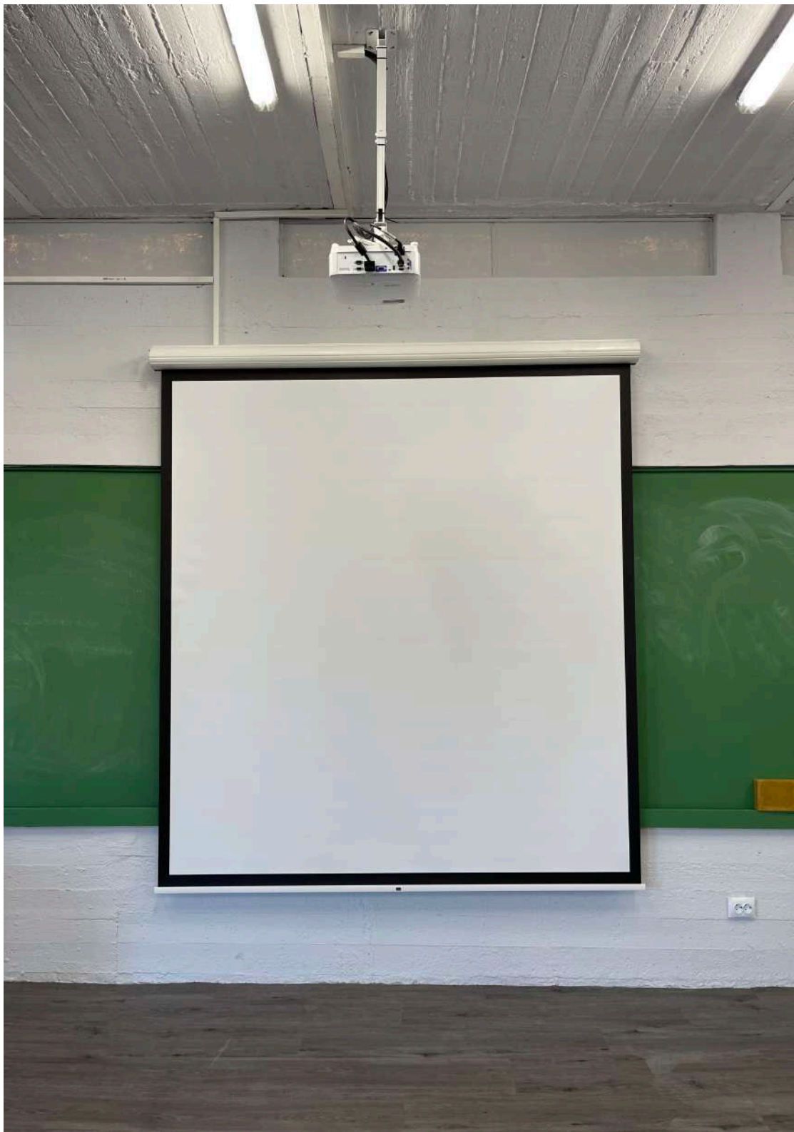
Ο νέος projector και η ηλεκτρική οθόνη προβολής σε πλήρη εφαρμογή.