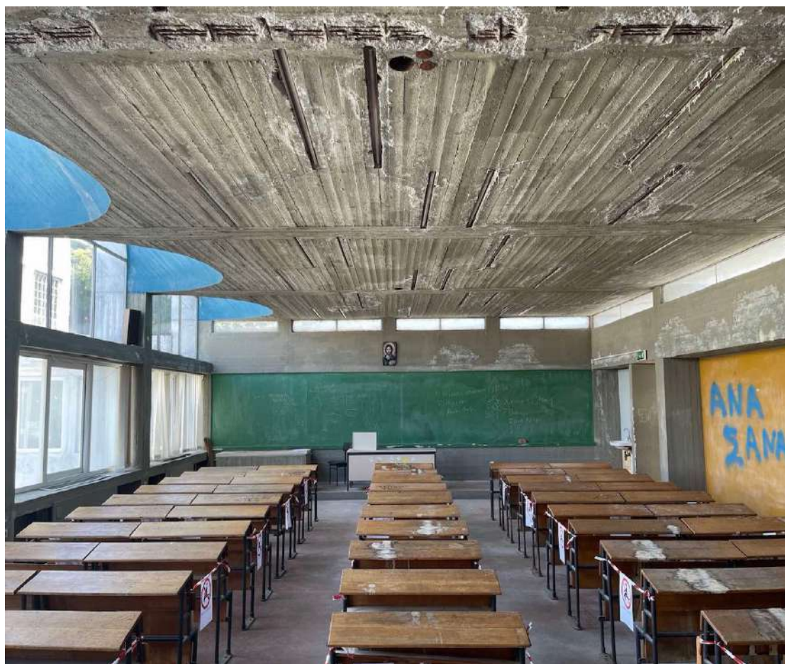
Η Β΄ Αίθουσα του Τμήματος Κοινωνικής Θεολογίας και Θρησκευολογίας (ΠΡΙΝ).