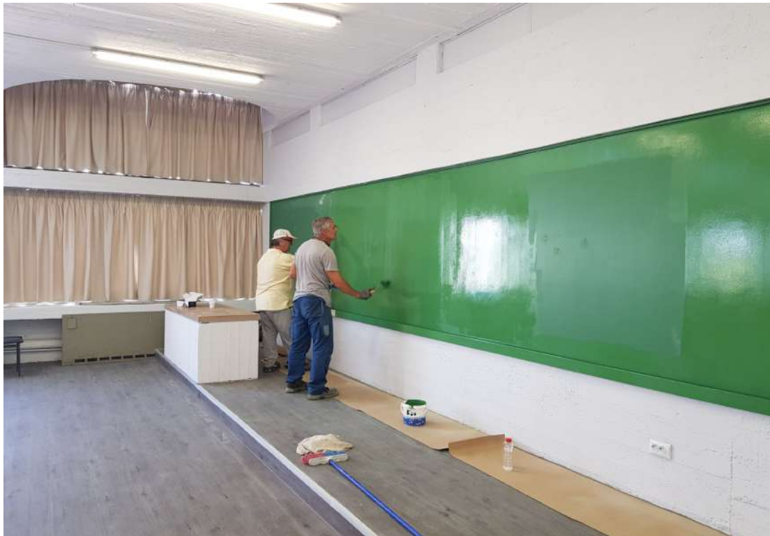
Αποκατάσταση του πίνακα.