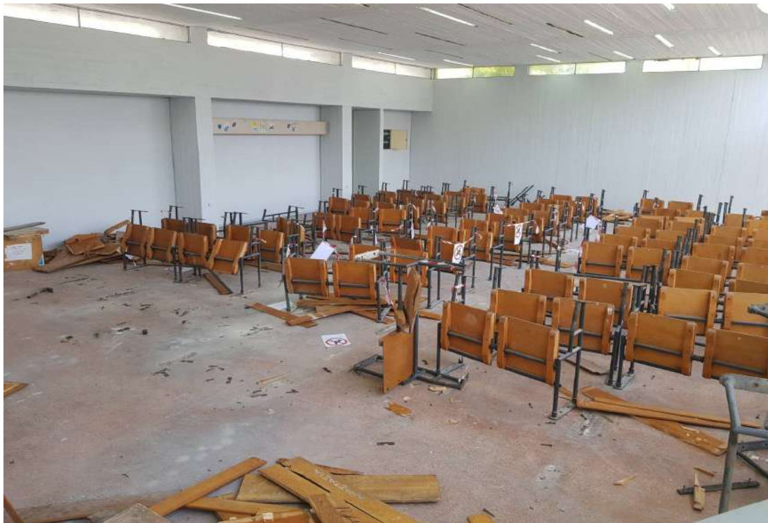
Αφαίρεση των κατεστραμμένων εδράνων των φοιτητών.