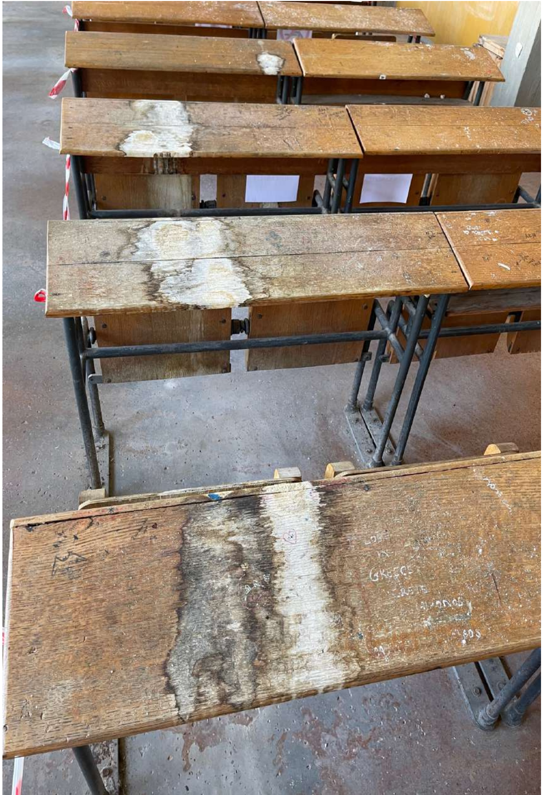
Τα έδρανα όπου φοιτούσαν οι φοιτητές μας.