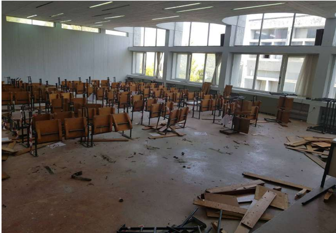
Αποξήλωση των σαθρών εδράνων.