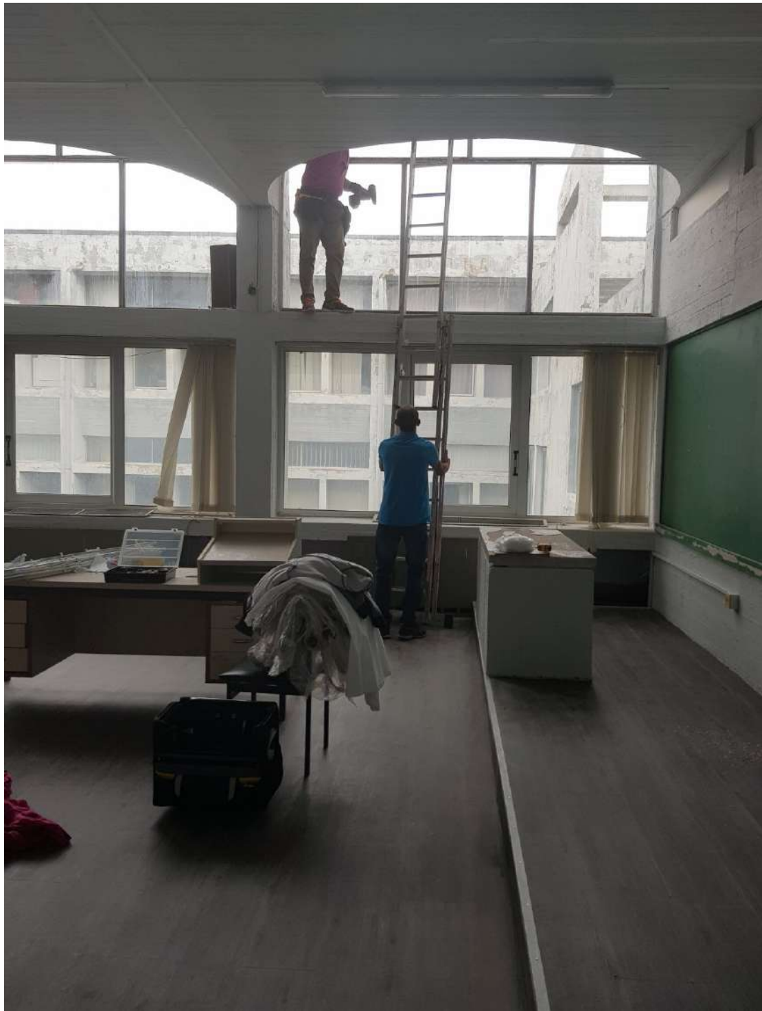
Αφαίρεση των παλαιών περσίδων από τα παράθυρα.