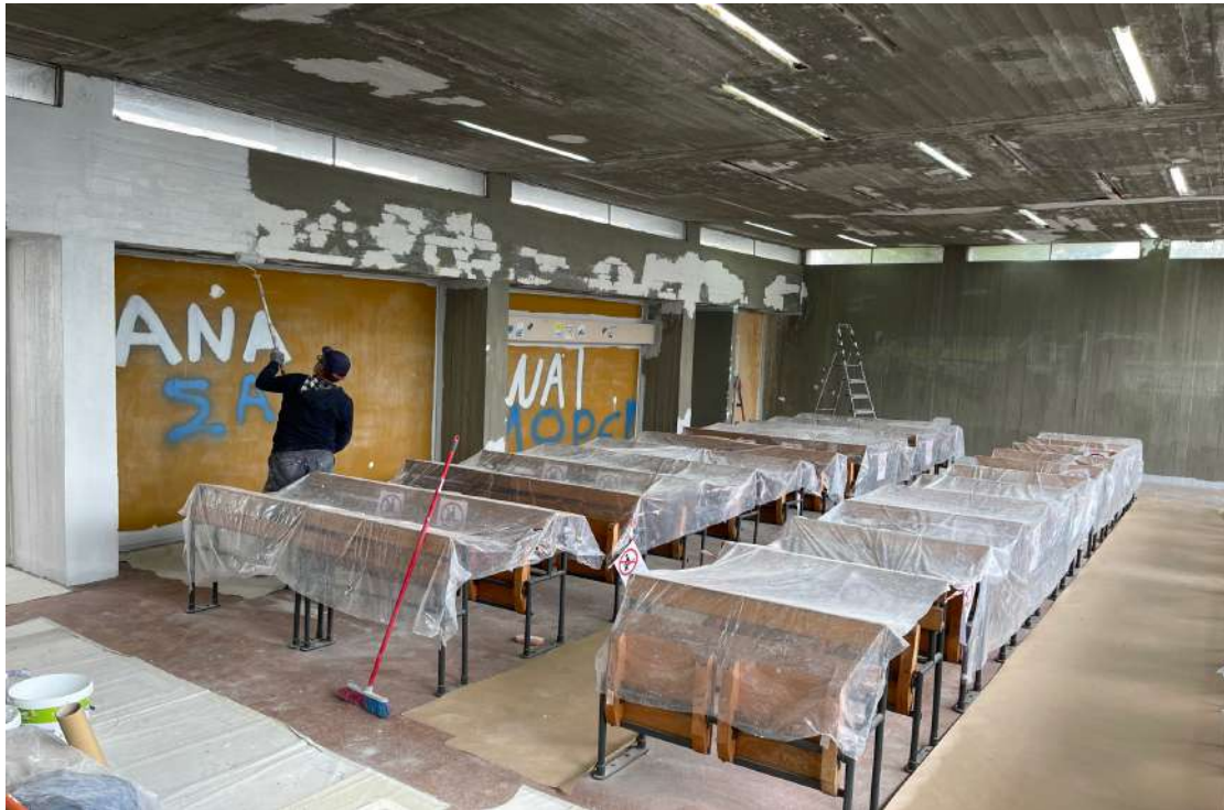
Βάψιμο των επιφανειών.