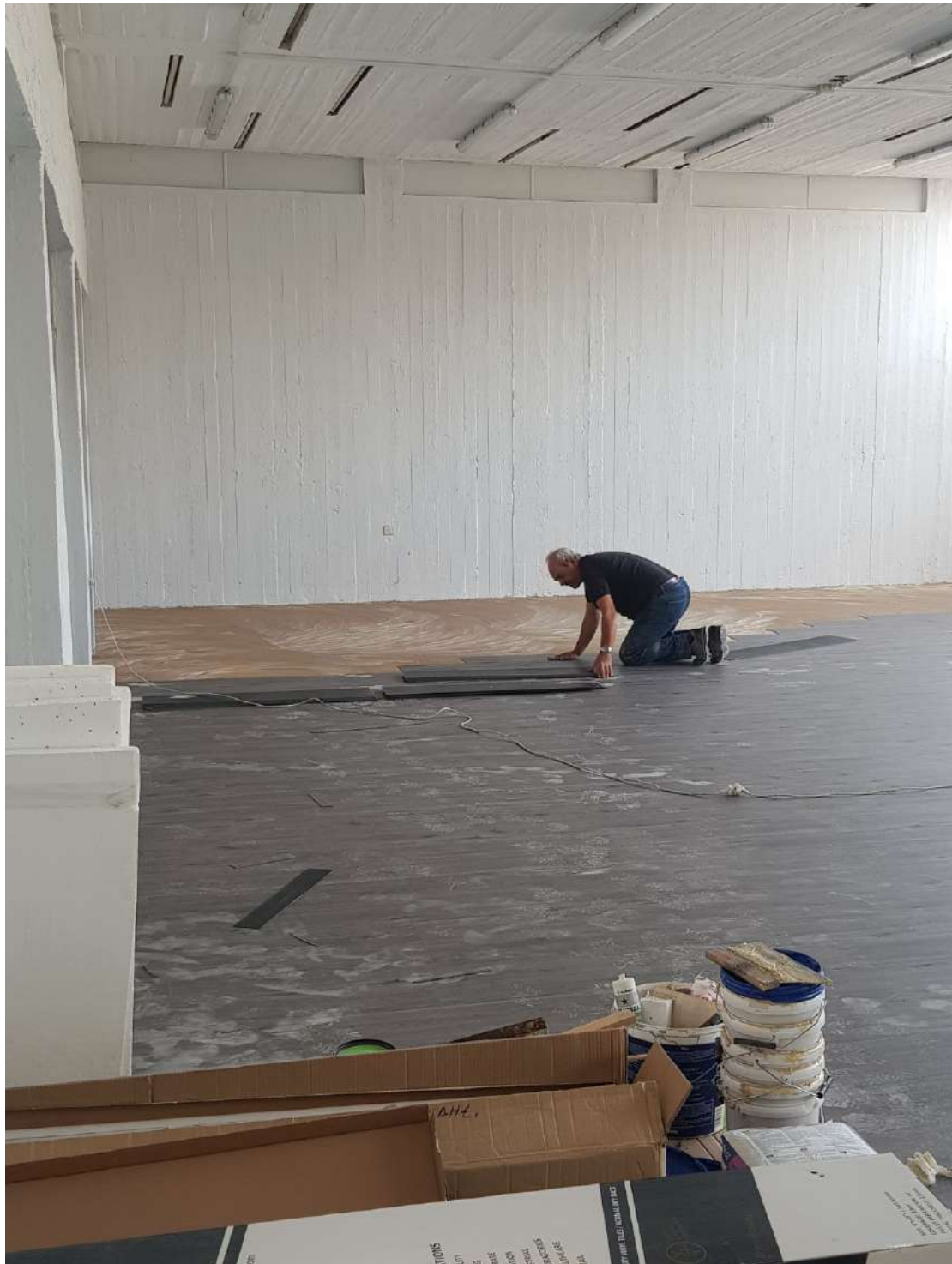
Τοποθέτηση νέου δαπέδου.